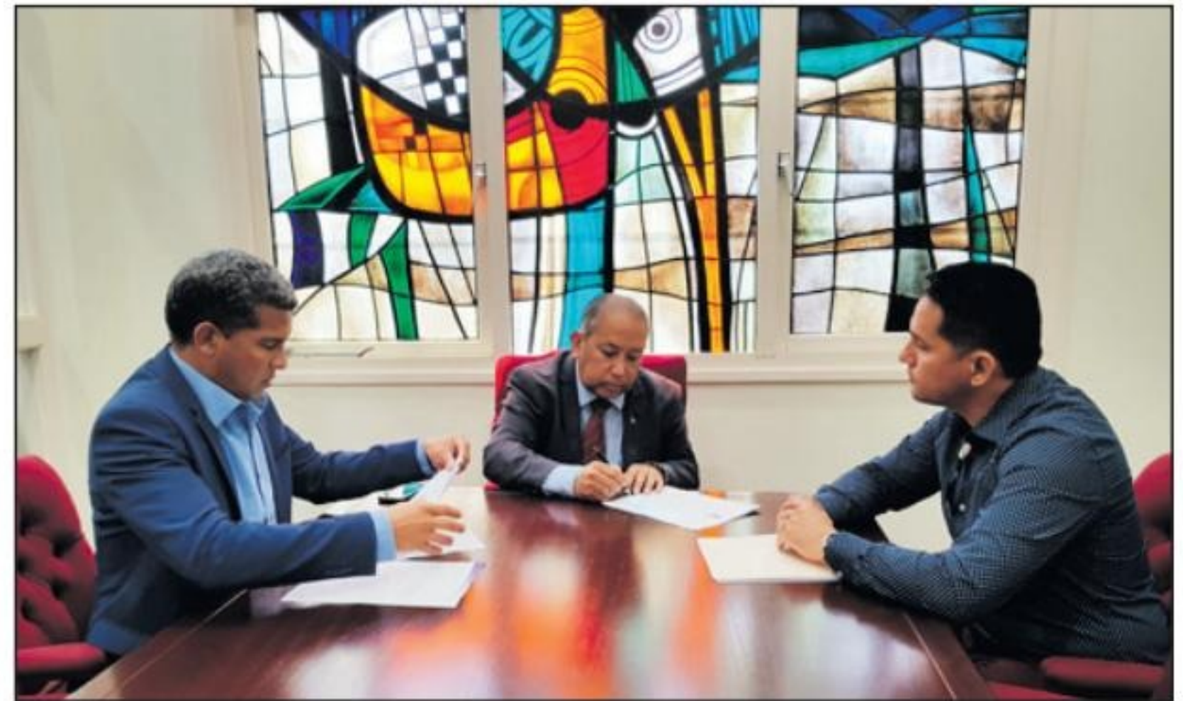
abao pa esaki realmente sosode, sin vacila y sin ningun excepcion.

Recientemente por a tuma nota cu nos Minister di Desaroyo Teritorial, Infraestructura y Medio Ambiente a tuma e decision pa introduci un 'voorbereidingsbesluit' riba e ROP cual tambe ta encera moratorium riba hotel. RAIZ ta aplaudi e decision aki y ta spera cu di berdad un moratorium riba hotel ta parti di e ROP nobo, anto uno cu lo funciona debidamente y cu NO wordo debilita pa excepcionnan politico, manera e caso di p.e. St Regis hotel. Si gobierno di Aruba kier introduci un moratorium riba hotel, e ora e mester pone pia